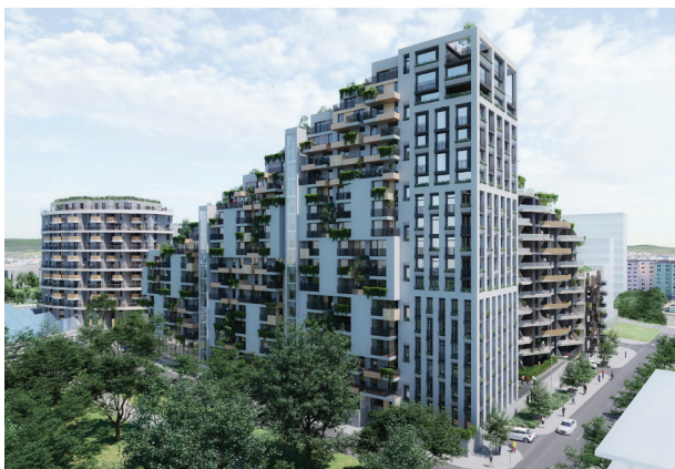
vizualizace: Západní Brána

V realizaci je projekt U Milosrdných na Praze 1 (kolaudace podzim 2024). Další z pražských projektů bytových domů jsou v přípravě: K Závěrci , Bytový dům Grébovka či Kačerov .