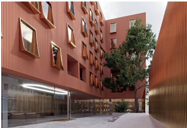
vizualizace: U Milosrdných

Mezi aktuálně prodávané projekty se řadí Jinonický dvůr v Praze (dokončeno), Nová Valcha v Plzni (dokončeno 6 etap z 11) či rezidence Nové Boroviny v Kladně (dokončena 1. etapa).